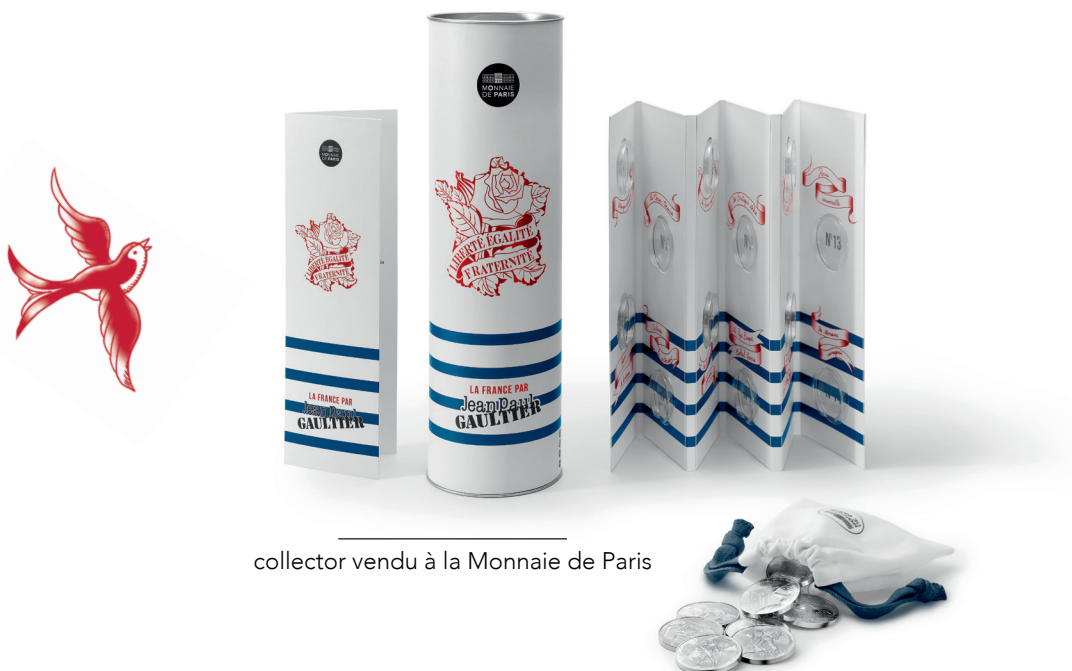
collector vendu à la Monnaie de Paris