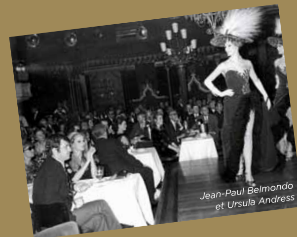
Jean-Paul Belmondo et Ursula Andress

Le célèbre affichiste Gruau, collaborateur de Christian Dior et de Vogue, dessine pour la revue « C'est magnifique » la première de ses affiches pour le LIDO. Elle sera suivie de nombreuses autres avec les spectacles « Quelle nuit, Avec plaisir, Panache, Bonjour la nuit ».